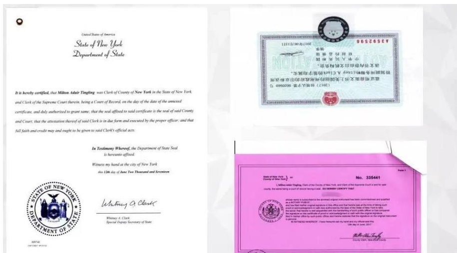
美国州政府及领事馆认证样本