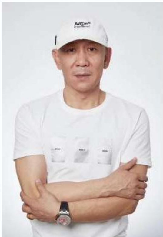
张闻君 导演 演员 制片人